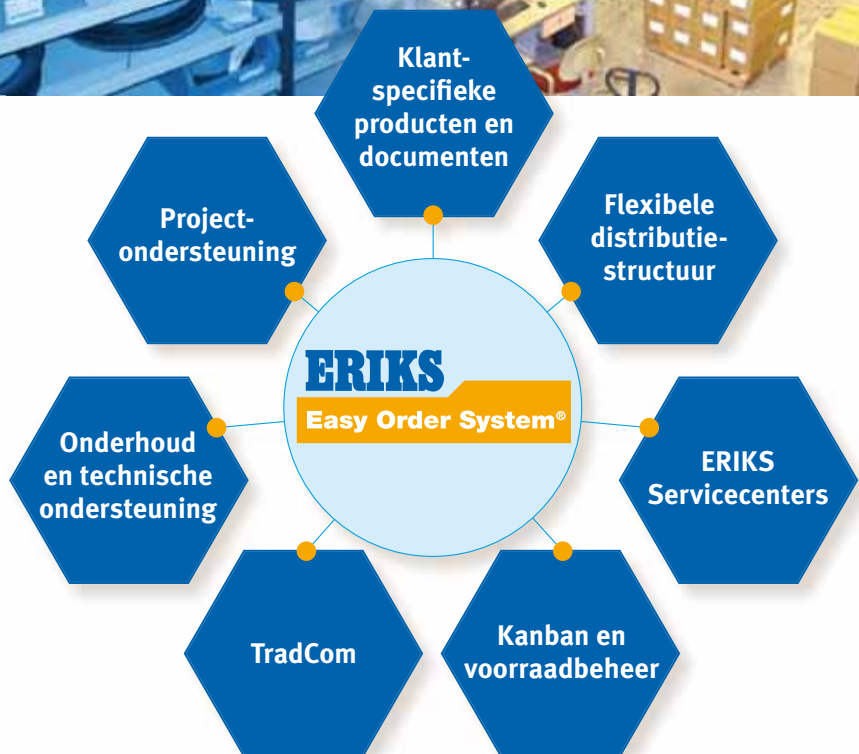
Total Cost of Supply

Het Easy Order System® vertegenwoordigt een breed pakket van goed ontwikkelde logistieke diensten en elektronische communicatie, gericht op verlaging van de total cost of ownership (TCO) bij onze klanten. Gedreven door technische kennis wordt het inkoopproces sterk vereenvoudigd en het aantal toeleveranciers verder teruggedrongen. Hiermee worden kostenbesparingen van 20% tot soms wel 40% van het inkoopbudget gerealiseerd.