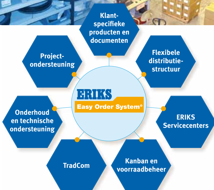
Total Cost of Supply

Het Easy Order System® vertegenwoordigt een breed pakket van goed ontwikkelde logistieke diensten en elektronische communicatie, gericht op verlaging van de total cost of ownership (TCO) bij onze klanten. Gedreven door technische kennis wordt het inkoopproces sterk vereenvoudigd en het aantal toeleveranciers verder teruggedrongen. Hiermee worden kostenbesparingen van 20% tot soms wel 40% van het inkoopbudget gerealiseerd.